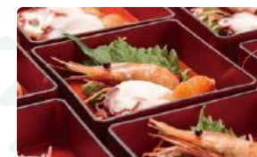
新鮮な魚介をお刺身で