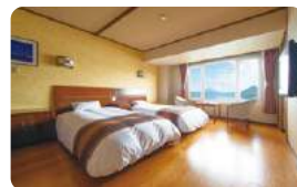
中央館 レイクビューツイン