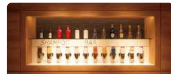
星の湯 シャンパーBAR