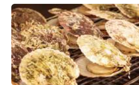
豪快に目の前で焼く海鮮焼き

洞爺湖周辺では、有珠山の噴火によってつくられたミネラルたっぷりの土壌や環境を生かして、約200種類の野菜が生産されています。また噴火湾では魚介類が豊富に水揚げされています。ホテルレイクサイドテラスではこれら四季折々の食材をふんだんに使用して、北海道の山海の恵みを存分に堪能できるお料理を提供しています。