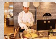
シェフの月替わりパスタ

ライブキッチンでは、石窯焼ピッツァ、エイジングビーフステーキ、寿司、天ぷらなど目の前でシェフが腕をふるいます。