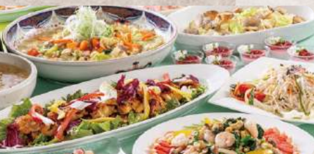
旬の食材をたっぷり使用したメニュー