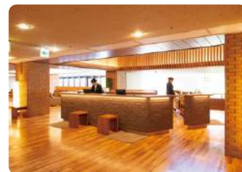
フロントカウンター