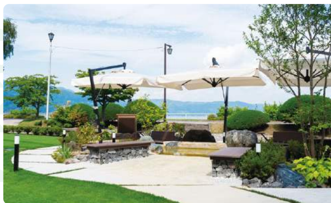
足湯「ちやますゆ～茶鱒湯～」

洞爺湖有珠山の歴史、火山活動による大地の恵みやそこで暮らしてきた人々や動物をテーマに約300冊を選書、洞爺湖町の蔵書もある「まちの図書館」として地域と旅人が触れ合う新たなカフェが2020年8月にオープン。ホテルの中庭には洞爺湖を望みコーヒーを味わう足湯もできました。