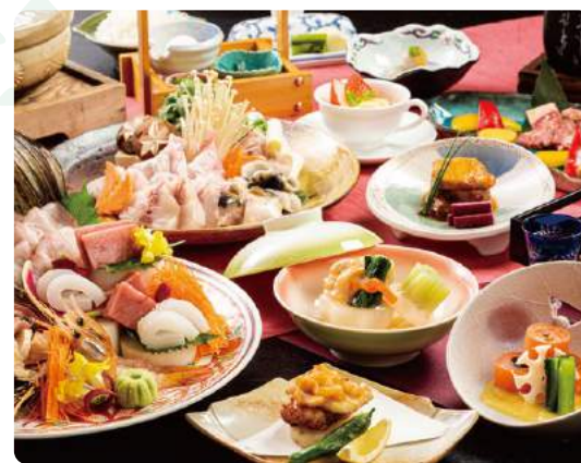
近郊食材と全国の逸品でつくりあげる特別会席「饗宴の膳」