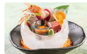
北海道の旬が詰まった贅沢な御造り