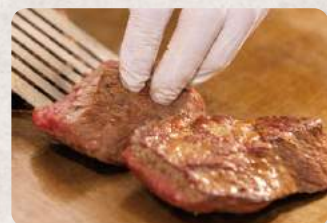
エイジングビーフステーキ