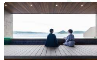
星の湯 足場テラス

2018年4月にリニューアルオープンした最上階大浴場「星の湯」。洞爺湖が目線に広がるインフィニティバスのほか、つぼ湯、腰かけ湯、寝そべり湯、寝湯、足場テラスと、絶景を堪能できる浴場へと生まれ変わりました。また、夜には眼前で花開く洞爺湖ロングラン花火大会を迫力たっぷり楽しめます。(4月末～10月末まで)