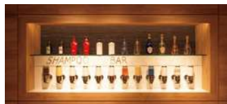
星の湯 シャンプーBAR