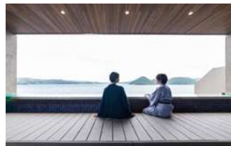
星の湯 足場テラス

洞爺湖が目線に広がるインフィニティバスのほか、つぼ湯、腰かけ湯、寝そべり湯、寝湯、足場テラスと、絶景を堪能できる大浴場。夜には眼前で花開く洞爺湖ロングラン花火大会を迫力たっぷりに楽しめます。(4月末-10月末まで)