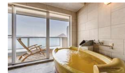
西館 特別室 温泉展望風呂

〈全館客室 計243室、全室禁煙、Wi-Fi完備〉 洋室 150室/和室 42室/和洋室 37室/ 和室コンビネーション1室/ 和洋室コンビネーション9室/ 特別室 4室