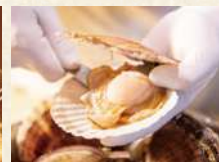
海鮮焼き ※時期により異なります。