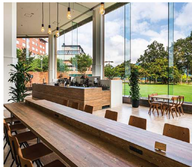
Library & Cafe 「BLOSSOM COFFEE」