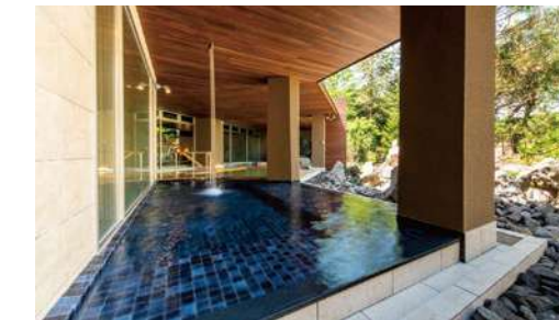
月の湯 露天水風呂