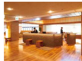
フロントカウンター