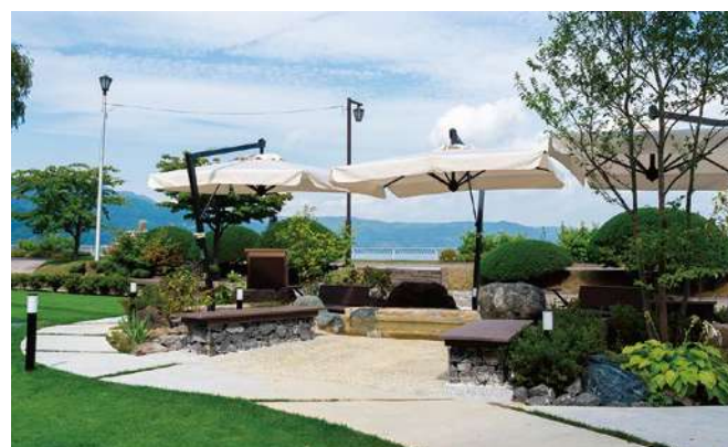
足湯「ちやますゆ～茶鱒湯～」

洞爺湖有珠山の歴史、火山活動による大地の恵みやそこで暮らしてきた人々や動物をテーマに約300冊を選書、洞爺湖町の蔵書もある「まちの図書館」として地域と旅人が触れ合うライブラリーカフェ。湖を眺めながらコーヒーを味わえる中庭の足湯は1年を通してご利用いただけます。