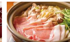
季節ごとのおもてなし