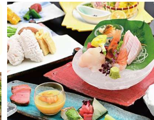
旬の道産食材をふんだんに味わう創作会席