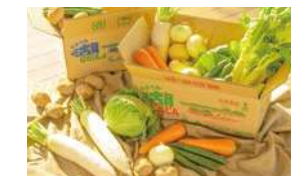
近郊産の野菜をふんだんに

洞爺湖周辺では、有珠山の噴火によってつくられたミネラルたっぷりの土壌や環境を生かして、約200種もの野菜が生産されています。また噴火湾では魚介類が豊富に水揚げされています。ホテルレイクサイドテラスではこれら四季折々の食材をふんだんに使用して、北海道の山海の恵みを存分に堪能できるお料理を提供しています。