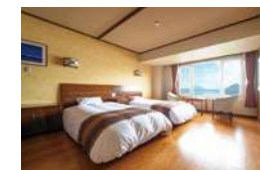
中央館 レイクビューツイン