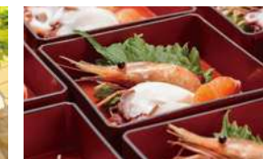
新鮮な魚介をお刺身で