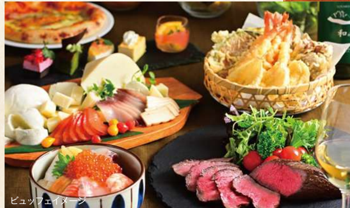
ビュッフェメニュー

自然のぬくもり溢れる空間と、大きな窓から望む洞爺湖の美しい景色が自慢。夕食のライブキッチンではピッツァやビーフ、パスタ、朝食ではおにぎりや卵焼き、漁師茶漬けなど、できたての味をご堪能ください。